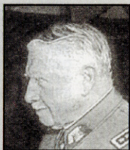
AUGUSTO PINOCHET UGARTE