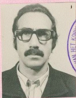
Foto van de houder Photo du porteur Photo of bearer