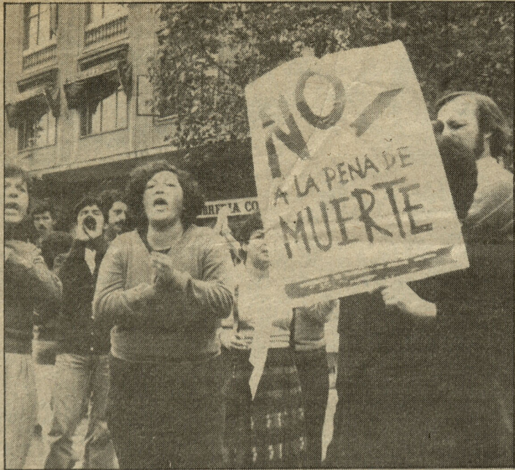
Pena de muerte, una polémica que se prolonga por años.

Aseguró que aumenta los índices de criminalidad