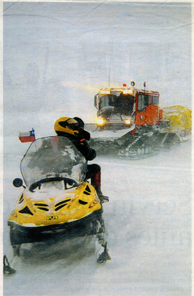
PESE A QUE primero el Ejército informó que el accidente se produjo durante una patrulla rutinaria, luego se reveló que eso era falso.