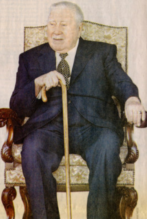
POCA COLABORACIÓN.— Según el informe de Pinochet, es poco lo que éste ha aportado para aclarar las dudas sobre el origen, uso y detalle de sus cuentas en el banco Riggs. Las respuestas las buscan tanto en Santiago como en Washington.

No es todo, ya que la misiva también arroja otro dato interesante en el último párrafo. Allí se afirma que la cuenta que el ex gobernante tenía en el banco se cerró el 6 de agosto de ese mismo año. "Luego que se enviaron los montos a un banco diferente a petición del cliente. La solicitud de transferencia