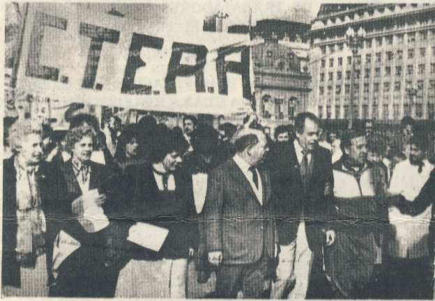
Marcha de la CTERA por la democratización y demandas del magisterio argentino.

Con ocasión del retorno a la democracia en el vecino país, Alfredo Bravo, antiguo secretario general de CTERA, ha asumido el cargo de subsecretario del Ministerio de Educación del gobierno del Presidente Raúl Alfonsín.