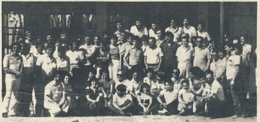
Asamblea de AGECH en Talagante; reafirmó las demandas del Magisterio Chileno.