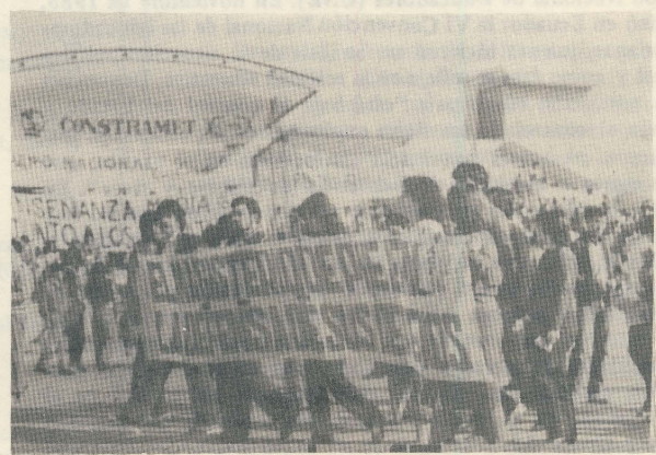
Masiva presencia de AGECH durante la celebración del 1º de mayo, en el Parque O'Higgins de Santiago.