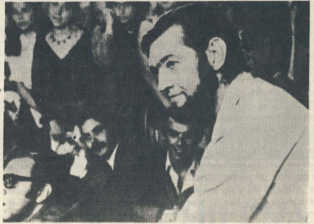
Cortázar con estudiantes Chilenos, durante su visita a nuestro país en 1968.

Los profesores por su parte son "el gran ejército de mal pagados, mal vistos y criticados". El documento termina con una pregunta a la oligarquía ecuatoriana, "¿Cuál es el planteamiento que vendrá a solucionar esta crisis educativa?". La respuesta es siempre vaga, promesas que no se cumplen y nadie está dispuesto a solucionar nada al menos en los gobiernos de turno.