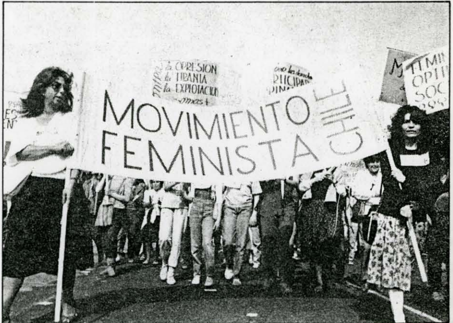
"Las mujeres constituimos la mitad de Chile, una mitad a veces indivisible a los ojos de la sociedad" afirman las integrantes del movimiento feminista.