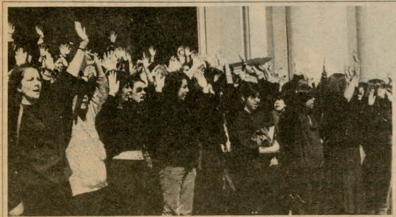
Luego que carabineros les quitaron el lienzo, las mujeres culminaron el acto entonando el himno nacional con las manos en alto, y sin la última estrofa, por supuesto

"Hoy es 11 de septiembre", decía el lienzo con que un centenar de mujeres recordaron el nuevo aniversario del golpe de estado, en las puertas de la iglesia de la Divina Providencia, exactamente a las 13 horas, mientras el general Pinochet se dirigía al país.