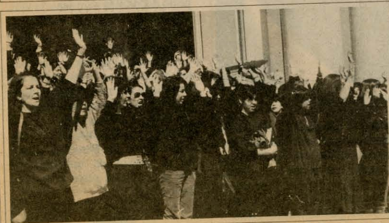
Luego que carabineros les quitaron el lienzo, las mujeres culminaron el acto entonando el himno nacional con las manos en alto, y sin la última estrofa, por supuesto