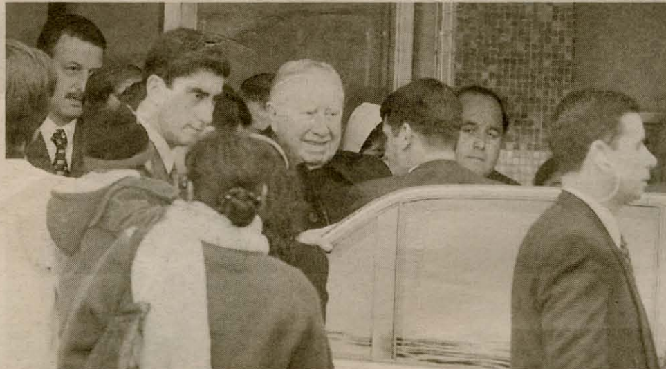
El senador vitalicio en uno de sus traslados al Hospital Militar, con el objeto de someterse a controles médicos.

Mientras la defensa de Pinochet pedía que este trámite se cumpliera en el Hospital Militar, los querellantes solicitaban que se llevara a cabo en Hospital Clínico de la Universidad de Chile. El ministro de fuero Juan Guzmán Tapia había decretado que los exá-